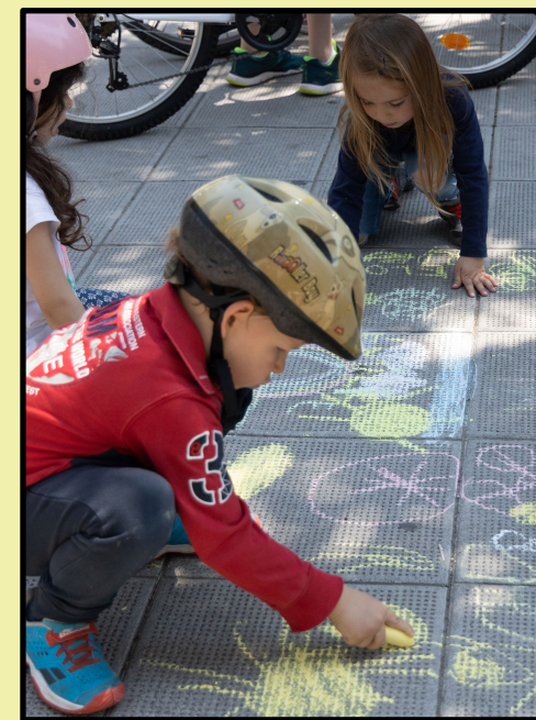
craie de trottoir