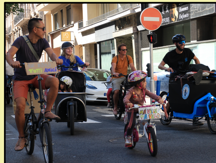
21 septembre 106 personnes (42 enfants)