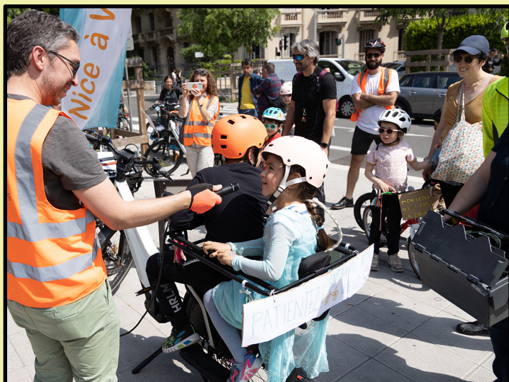
07 mai 44 personnes (25 enfants)