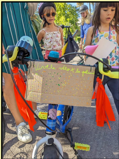
atelier chou-chou à franges et pancartes