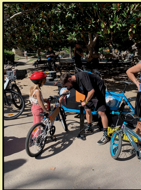
réglage vélo minute