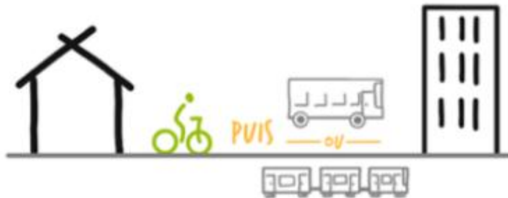
Cas 1 : Intermodalité