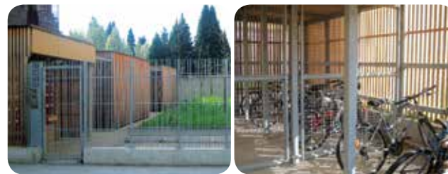
Résidence Le Tournesol de l'éco-quartier Blanche-Monier de Grenoble, (par Actis OPH), avec quatre garages de tailles moyennes (18 m 2 ) pour que les habitants ne soient pas trop nombreux à utiliser le même local et puissent identifier qui y met son vélo. Cela diminue le risque de vol tout en conservant une bonne capacité de stationnement.

A l'extérieur des bâtiments, les abris couverts protègent des intempéries. Une structure à claire-voie (présentant des vides ou des jours) ainsi qu'un bon éclairage permettent une utilisation plus pratique à toute heure et renforcent le sentiment de sécurité. Pour limiter le risque de vol, il est conseillé de ne pas dépasser 20 vélos par local.