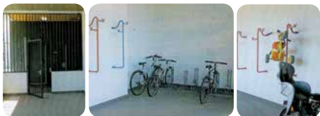
Résidence Louis Aragon de l'éco-quartier Monconseil à Tours, par Tour(s) Habitat. Un accès facile et rapide depuis la rue et un stationnement différencié entre les vélos enfants et les vélos adultes.

Le vélo est utilisé pour sa rapidité de porte-à-porte. Un accès de plain-pied, par un plan incliné ou encore une goulotte le long d'un escalier permet son utilisation facile et rapide. De la même manière, il est conseillé de limiter le nombre de portes à franchir avec le vélo à la main.