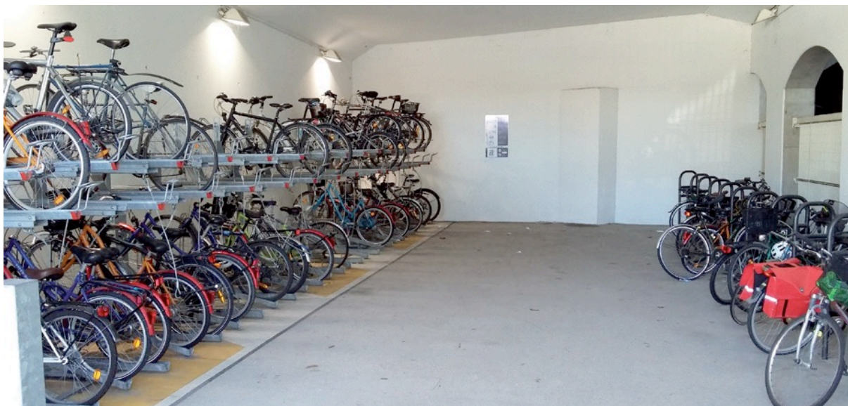
Figure 1 Exemple de local à vélos

Un local à vélos sécurisé et équipé est défini comme un espace de stationnement intérieur ou extérieur pour vélos (voir Figure 1), protégé contre les intempéries et dont l'entrée est accessible à l'aide d'une clef (ou d'un badge). Il comprend les éléments nécessaires pour acheminer et ranger un vélo aisément (support de fixation pour vélos, éclairage, dispositif d'ouverture automatique des portes, etc.).