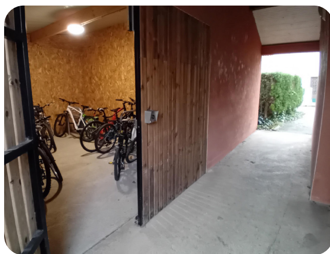
Habitat social (24)

Un espace sécurisé de plain-pied accessible à vélo