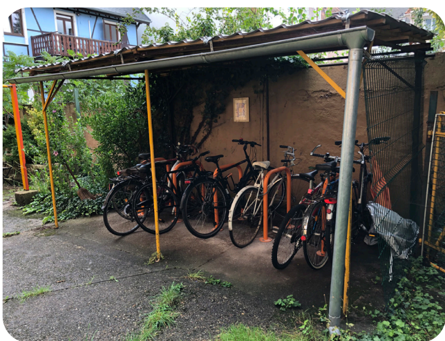
Copropriété privée (67)

Un espace dédié aux vélos dans une cour privée