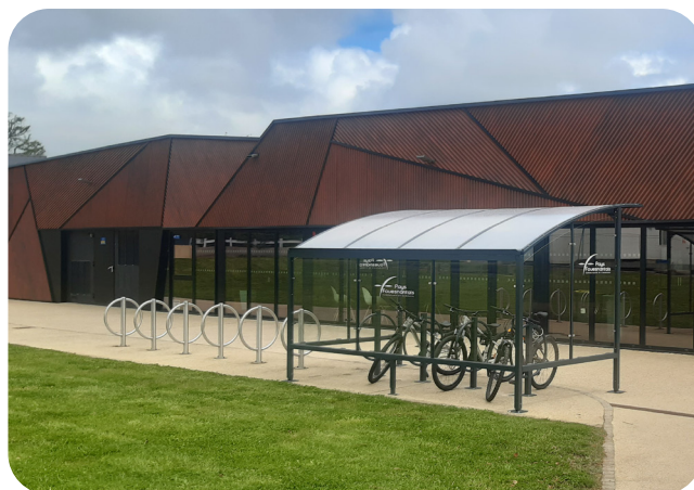
Site multisports (29)

Deux espaces de stationnement, l'un abrité et l'autre non, à proximité immédiate de l'entrée