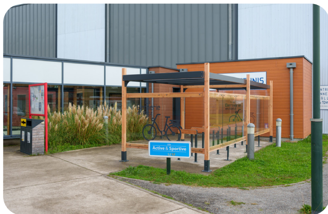
Site multisports (44)

Un espace de stationnement vélo abrité et ouvert, installé à proximité immédiate de l'entrée et signalisé par des adhésifs vélos sur l'abri