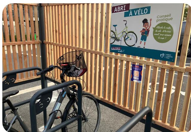
Site public (63)

Un stationnement paré d'une affiche indiquant des conseils pratiques à l'attention des usager-es